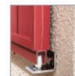
Guidage bas fixé en façade