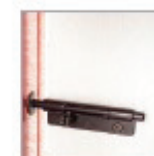
Fermeture par verrou fixé sur le tableau