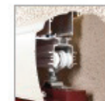
Guidage haut sur rail aluminium en façade avec capot