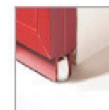
Guidage bas sur appui ou terrasse