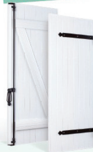
Modèle présenté : Blanc