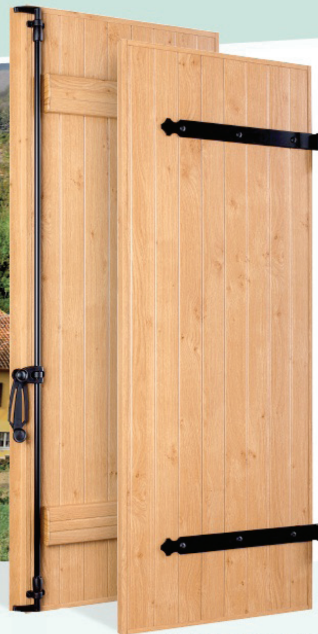
Volet battant en PVC à barres seules, chêne irlandais

FRANCE VOLET présente une gamme très complète de volets battants en PVC avec des profils finement moulurés : à pentures et contre-pentures, à barres et écharpes ou encore à barres seules. Les volets en PVC présentent l'avantage de permettre un entretien facile à l'eau savonneuse et durent dans le temps.