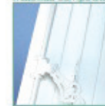
Poignée d'espagnolette en aluminium blanc