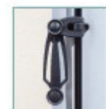
Espagnolette recoupable en aluminium et matériau composite