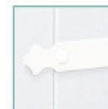
Penture en aluminium blanc à bout festonné