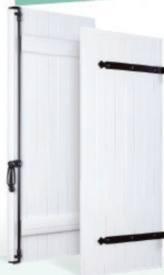
Modèle présenté : Blanc