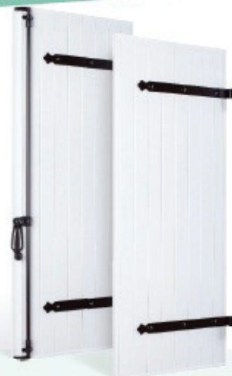
Modèle présenté : Blanc