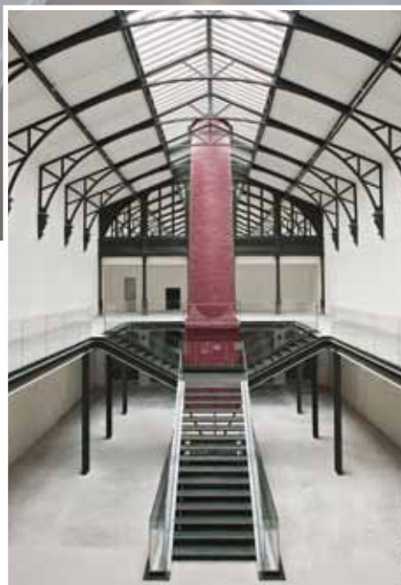
© Pierre Audat Architecte / www.pierreaudat.com